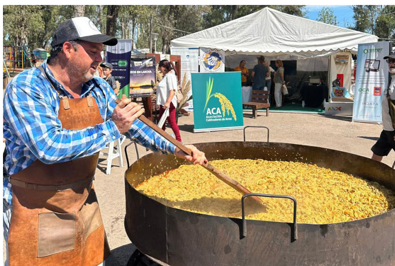
Cada actividad es una fiesta

Si bien es probable que estos valores no se repitan en 2025, la situación de India como principal actor global transcurre con más de un año de restricciones en exportaciones, con aspectos económicos como la inflación y la búsqueda de la seguridad alimentaria. Aunque puede abrir